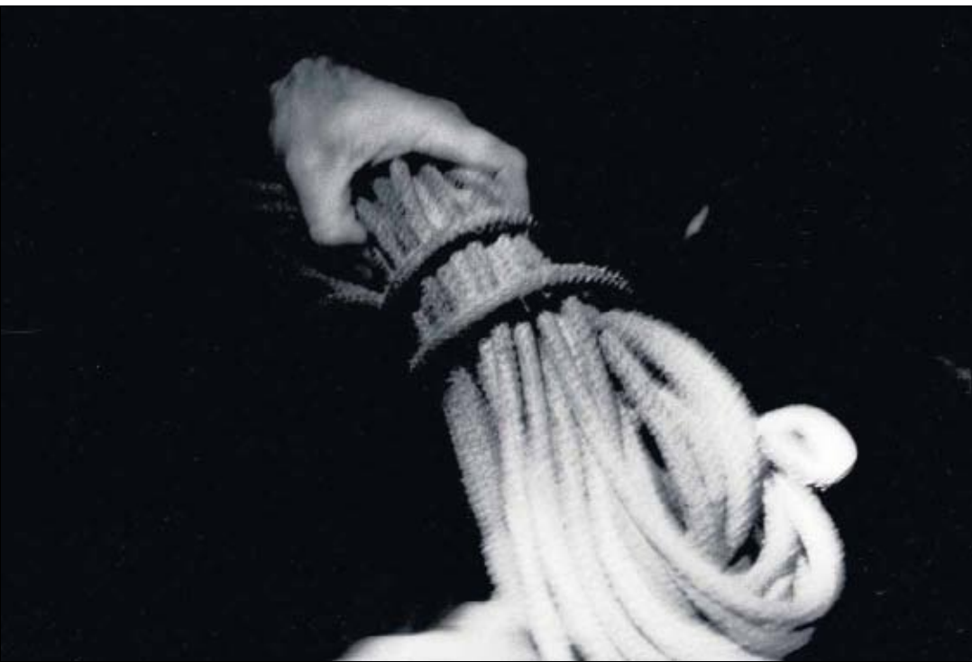
Handgriffe über dem Wasser verknüpfen sich zu Handlungen, um Plankton zu strudeln.